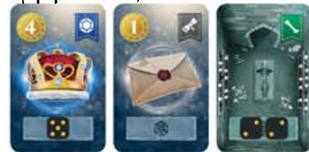
Παράδειγμα τοποθέτησης ζαριών Υπηρετών

Απόκτηση: Τοποθετήστε οποιονδήποτε αριθμό Υπηρετών στις επιθυμητές κάρτες Θησαυρών επιλέγοντας οποιαδήποτε τιμή στο ζάρι σημειώνοντας την προσπάθεια που καταβάλει κάθε Υπηρετής. (Όσο μεγαλύτερη η τιμή, τόσο πιο πιθανό να κουραστεί ο Υπηρετής σας.) Μπορείτε επίσης να τοποθετήσετε πολλούς Υπηρετές στην ίδια κάρτα Θησαυρού, αρκεί να έχουν την ίδια τιμή προσπάθειας.