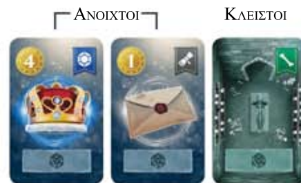
Παράδειγμα Κρύπτης 2 παικτών

Οι πρώτες κάρτες που θα τραβηχτούν τοποθετούνται ανοιχτές. Οι τελευταίες τοποθετούνται κλειστές.