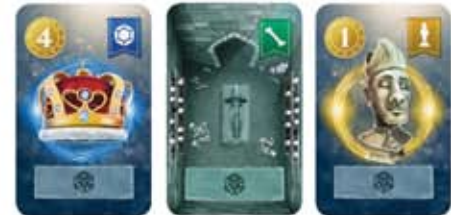
Παράδειγμα Κρύπτης ατομικού παιχνιδιού

Ταξινομήστε τις κάρτες Θησαυρού από την μεγαλύτερης προς την μικρότερης αξίας Νομισμάτων. Η κλειστή κάρτα θεωρείται σαν 2.5 Νομισμάτα. Αν δύο κάρτες είναι ίσες, η πρώτη που τραβήξατε τοποθετείται στα αριστερά.