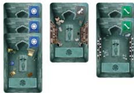
Παράδειγμα Θεσαυρών ενός παίκτη

Τοποθετήστε τους Θεσαυρούς σας κλειστούς σε στήλες, χωρισμένες ανά είδος. Μπορείτε να βλέπετε τους Θεσαυρούς σας όποτε επιθυμείτε.